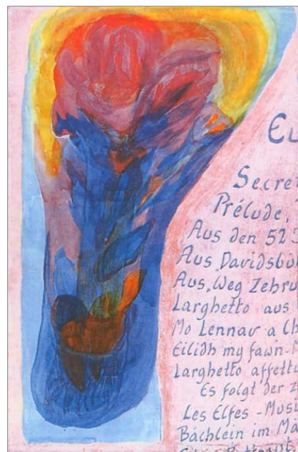
Рудольф Штайнер, «Прарастение», акварель, апрель 1924 г.

Гёте ощущал себя вправе рассматривать в качестве результата наблюдения то, что формировалось у него в идеях о вещах природы, как он это делал, например, в отношении красного цвета розы. Для него наука была духовно наполненным и в то же время объективным результатом наблюдения. Шиллер не мог совладать с подобным воззрением. Для него было твёрдо определённым, что человек должен только из себя формировать идеи, если он хочет охватить данные лишь как отдельные результаты наблюдений. Гёте чувствовал себя со своим духовным содержанием стоящим внутри природы, Шиллер ощущал себя с тем же самым вне природы. Кто проследит в переписке Гёте и Шиллера жизнь их дружбы, тот увидит, как она всё больше углубляется благодаря тому, что Шиллер осваивается в способе воззрения Гёте. Он приходит к тому, чтобы допустить объективное господство духа в творениях природы, что для гётевского способа представления было чем-то само собой разумеющимся. Можно сказать, что Шиллер отделил поначалу от Гёте точку зрения, что человек стоит вне природы, и что он, когда высказывается о природе, к ней кое-что прибавляет. Гёте никогда не сомневался в том, что в человеке природа сама выражает свою сущность как духовное содержание, если только человек ставит себя в верное к ней отношение.